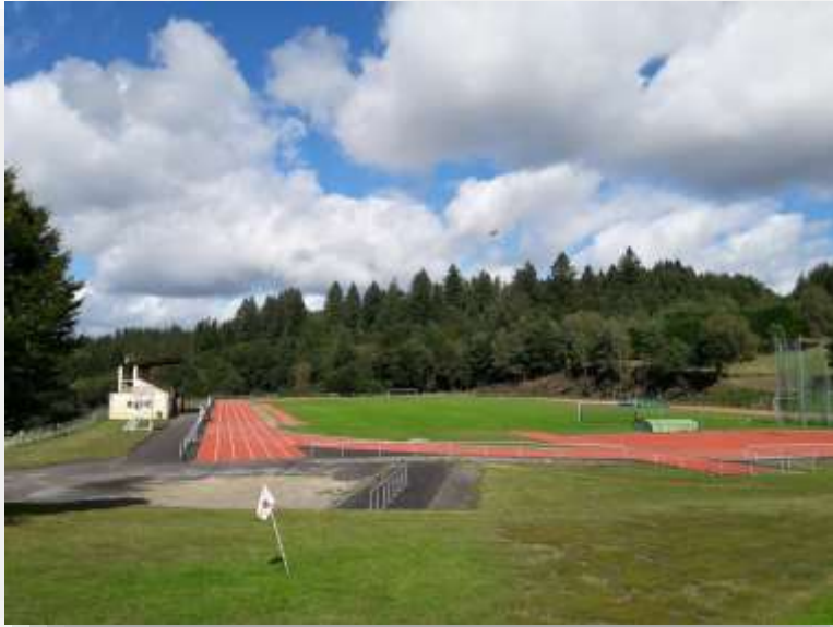
La piste d'athlétisme et le terrain de football