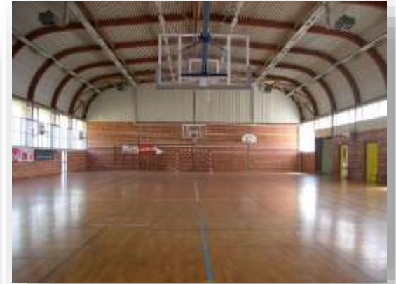
Le gymnase Parquet (44x22)