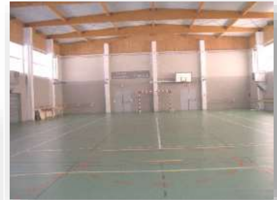
Le gymnase Tarket (32x19)