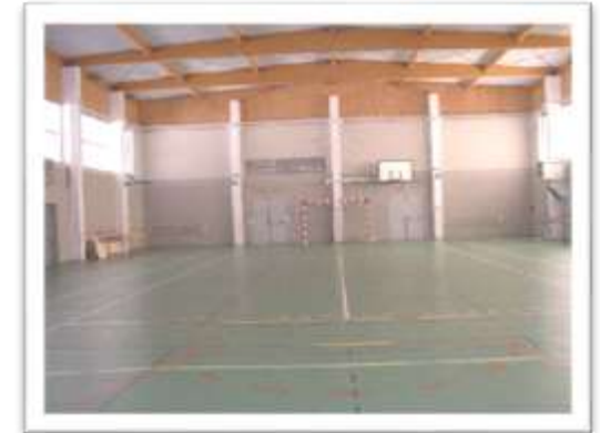
Le gymnase Tarket (32x19)