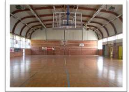
Le gymnase Parquet (44x22)