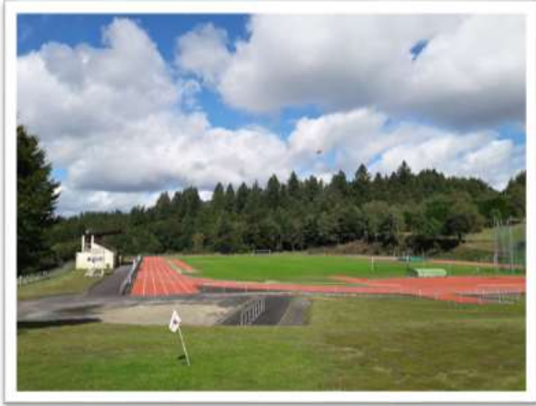
La piste d'athlétisme et le terrain de football